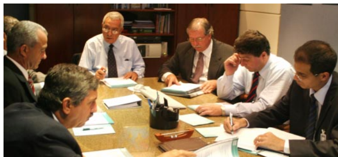
Dirigentes dos associados participam de almoço e da Assembléia, na sede da Asbace