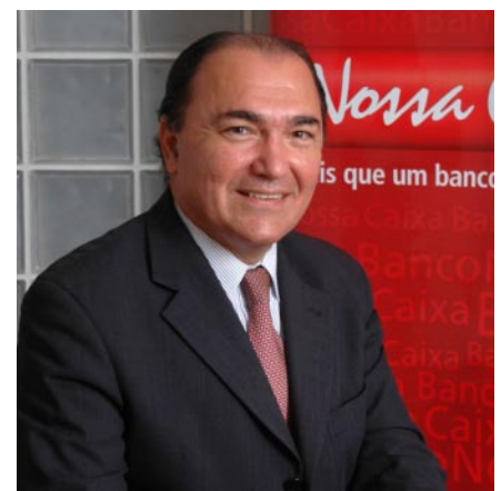
Milton Luiz de Melo Santos, presidente do Banco Nossa Caixa

De acordo com o balanço do Banco, ao longo de 2006, o total de novas contas correntes abertas foi de aproximadamente 800 mil. Desse total, 210 mil não são funcionários públicos e sua soma à carteira de clientes reflete a continuidade do trabalho que vem sendo feito pela instituição para consolidar-se