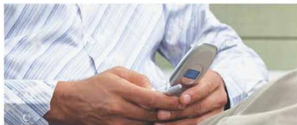
Através de aparelhos como smartphones e celulares, a Asbace oferece as mais novas soluções em Mobile Banking

Banking é o acesso ativo, em que o cliente, através do seu próprio aparelho celular, pode acessar informações sobre saldo e extrato de conta corrente, efetivar ou agendar pagamentos de títulos, boletos bancários e também contas de concessionárias de serviços públicos. Transferências de contas correntes do mesmo banco, DOC ou