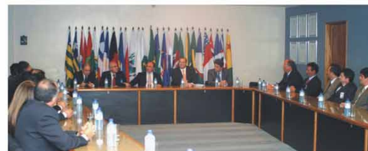
Visão geral da reunião com os diretores do Banco Central