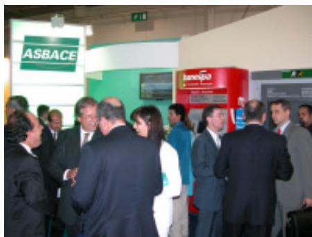
Movimentação intensa no estande da ASBACE

Atualmente, a RVA dispõe de mais de 38.000 terminais de atendimento interligados em todo o país, em operação nas 24 horas do dia e sete dias por semana. Seus serviços são disponibilizados por 13 bancos (Banese, Banespa/Santander, Banestes, Banpará, Banrisul, BEC, BEM, BEP, BRB, BESC, Mercantil do Brasil e Nossa Caixa) a uma base de 15 milhões de usuários. Além disso, a RVA permite os mais diversos protocolos de comunicação existentes no mercado e tem seus processos certificados de acordo com as normas internacionais de qualidade ISO 9001:2000.