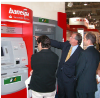
Soluções de auto-atendimento da ASBACE atraíram o público do Ciab