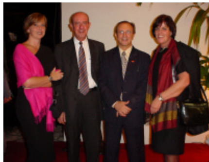
Convidados e executivos da Nossa Caixa durante conquetel de inauguração da nova agência