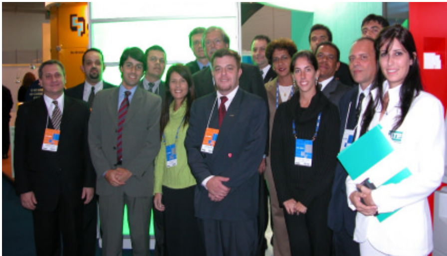
Equipe de executivos da ASBACE presente no Ciab