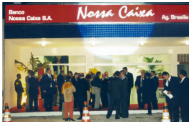
Fachada da nova agência do Banco Nossa Caixa

O governo paulista pretende vender até 25% do controle acionário do banco, e a Assembléia Legislativa estadual já autorizou a venda de até 49% do controle. Foi aprovado ainda projeto para criar até sete subsidiárias. Duas já estão em operação: cartão de crédito e previdência privada.