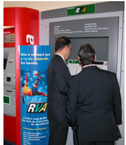
Participante do Ciab utilizando equipamento de auto-atendimento no estande da ASBACE