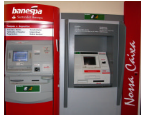
Equipamentos de auto-atendimento instalados no estande da ASBACE